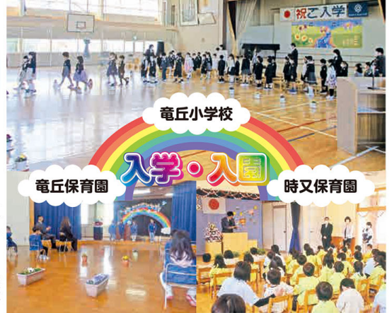
竜丘小学校 入学・入園 竜丘保育園 時又保育園

六月五日に予定されていた「第十四回竜丘古墳まつり」は、新型コロナウイルス感染症の状況を考慮し、残念ながら今年度も中止となりました。六月生しにわたりました日行い、八月中旬以降に野焼きが行われる予定です。