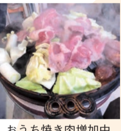
おうち焼き肉増加中

近頃の公園など屋外へ、テラスター・ノンフライヤーを駆使している調理して食べているので絶対コロナ太り進行中です。(男子大学生)