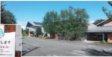
公民館や図書館も休館 (8/20～9/12)