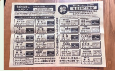
竜丘商工会もテイクアウトやっています

会社での取引先が観光地のお土産や飲食店関係なので、コロナ禍になって仕事が少なくなった。会社も事業を縮小している。この先不安である。(食肉加工業) お客さんの入りはそんなに変わらないかな。昨年の非常事態宣言の時は、飲食店ばかりでなく食品スーパーも短時間営業がかなり夜十時までが夜八時までとなり二時間分の収入が無くなった。(スーパー店員) お客様の来店頻度が少なくなってきました。そのかわり、一回の買い物量が増えています。また、カード払いが増えました。お金のさわりたくない、あるいは収入が減ってきたことが、その理由かなと思います。(スーパー店長) 担当している仕事が多くなり週休四日となった。それから関連会社に出向になった。(警察官)