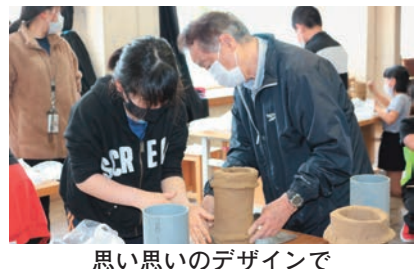
思い思いのデザインで

六月六日に竜丘小学校六年生が製作した埴輪の野焼きが行われました。 午前六時に点火。竜丘古墳の会の福岡さんによると、温度の調整が大切で、最初は中止となりました。しかし、竜丘小学校の六年生が総合的な学習の時間に公民館育成委員会と連携して取り組んだ埴輪づくりの仕上げとして、埴輪の野焼きが行われました。 野焼きには育成委員会と古墳の会のメンバー、六年生と先生も数名駆けつけ、思い思いのデザインで