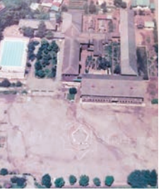
100周年記念時の人文字

公民館では竜丘小学校開校150周年記念事業に向けて、小学校にまつわる資料やみなさんの思い出などを募集します。特に、直近の50年(昭和47年)以降の資料が不足しています。入学式、運動会、旧校舎、人文字などの写真や、卒業アルバム、卒業文集などをご持参いただけます。(提供物品は後日返却させていただきます。)