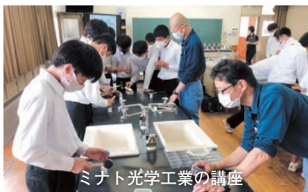
ミナト光学工業の講座

年一回の中学生との交流では、旭松食品の生い立ちから現在の会社状況を説明しました。また、今後の進路選択の参考となる、企業が求める人材を、具体的に説明し生徒の皆さんが、真剣な表情で聞き入ってくれました。