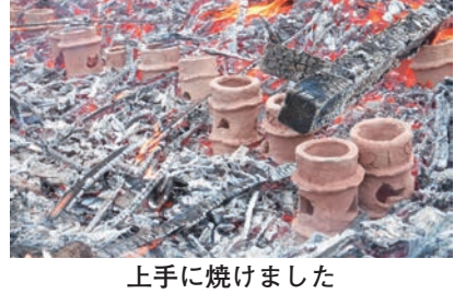
上手に焼けました

野焼きの始まった当初は、埴輪が割れてしまふ事もあったようですが、回数を重ねることに要領が分かり、上手に焼けるようになってきました。今回も一つひびが入っただけで上手に焼きあがりました。 太古の昔にこの地で行われていた埴輪の野焼きが、千五百年近くたった現代に行われていることに不思議な感じを受けながら、竜丘の文化を感じる大切なひとときとなりました。