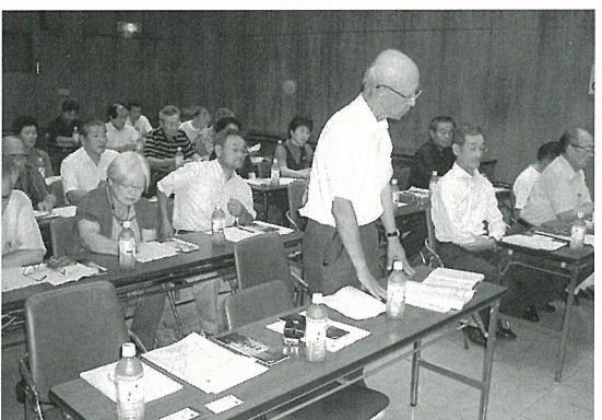
放課後子ども教室の現況を聞く

今年ファイリビンのレガスピ市の参加型地域社会開発(PLSD)プロジェクトの報告会が二十三日に行なわれました。そのなかで