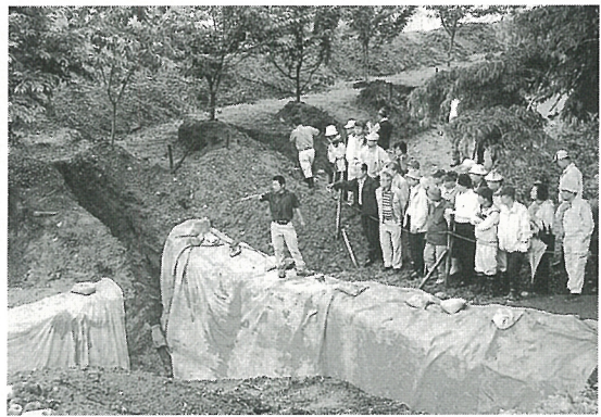
薬研堀の説明の一コマ

今回の発掘調査は、今年五月から六月にかけて、飯田市教育委員会が鈴岡公園の整備・保存のための確認調査として、二郭などを部分的に調査しました。