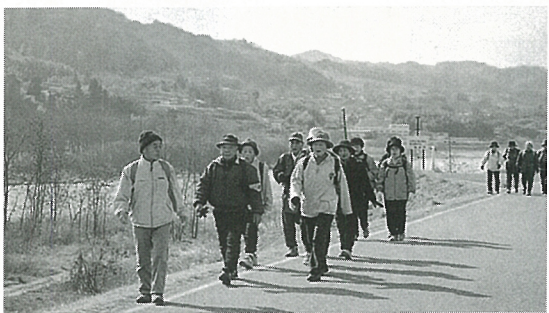
天竜川沿いを歩く会員

その成果は、会員の皆が健康な体を保たれている事で証明されています。また四月には「飯田やまびこマーチ」が、今年も二十回の記念大会として開催されます。