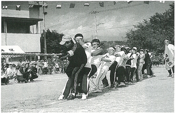
熱戦を繰り広げた運動会(10月)

今年度の文化事業を、委員の方々に計画頂き、実行してまいりました。防災と開園百周年を迎える鈴岡城址公園をテーマとした市民大学講座、芸術的な人形劇に親しめるよう初の有料公演を