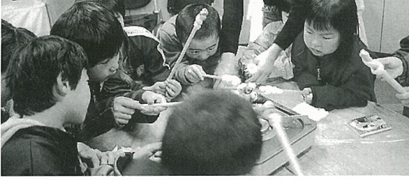
文化祭での食育ブース(11月)

今年度も、貴重な民俗資料を後世に伝え残し、竜丘の皆様への心の寄り処、癒しの館として、資料館の充実を期してまいりました。しかしながら、皆様のご承知の通り、現資料館の老朽化は更に進み、資料の収集保存が困難な状況となっ