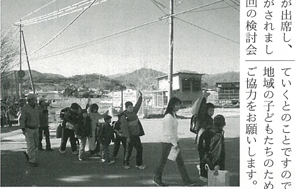
一斉パトロールの様子

今年度の食育活動は、地域住民の親睦交流と健康の維持増進を方針に活動しました。多くの地域の方が参加して下さった市民運動会。各分館で定着しているソフトボールで交流することができました。多くの地域住民が気軽に参加できる大会としてペタマスタース、冬季スポーツフェスタを開催し、ニューボールを楽しむことができて