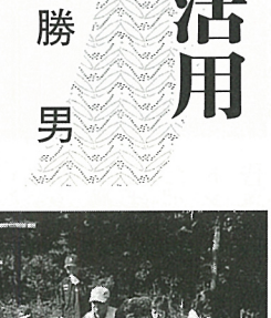
里山を活用した公民館活動