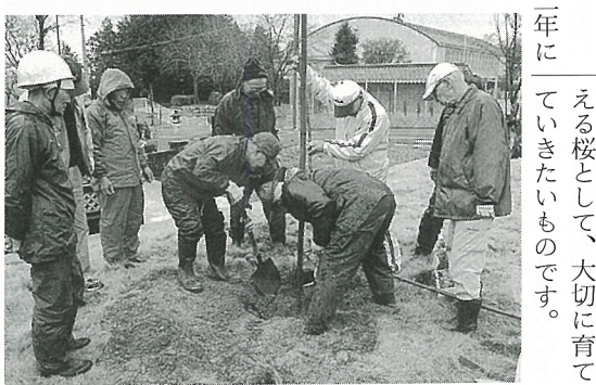
雨情しだれを植樹

一月二十二日に竜丘小学校体育館と竜丘公民館ホールで、冬季スポーツフェスタが総勢七十名の参加を得て開催されました。対抗意識や勝敗を重視せず気楽に楽しめるよう、分館対抗ドッチビー大会を変更して、個人種目も含め複数の種目を取り入れた大会としました。