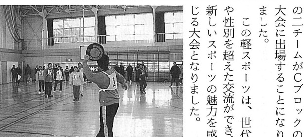
竜丘ドッチビー大会