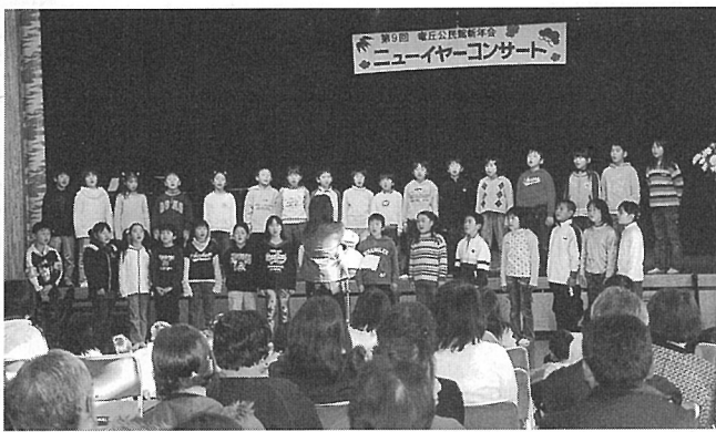
熱唱する小学生のみなさん

息を合わせた、岳風会詩吟教室竜丘の皆さんによる詩吟の発表も目を見張るものがありました。