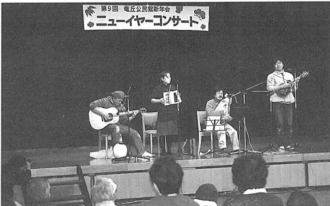
めずらしい楽器がよりどりみどりで

めずらしい楽器がよりどりみどりで楽しめます。皆さんも、このように手作りのコンサートに参加してみたいかがでしょうか。