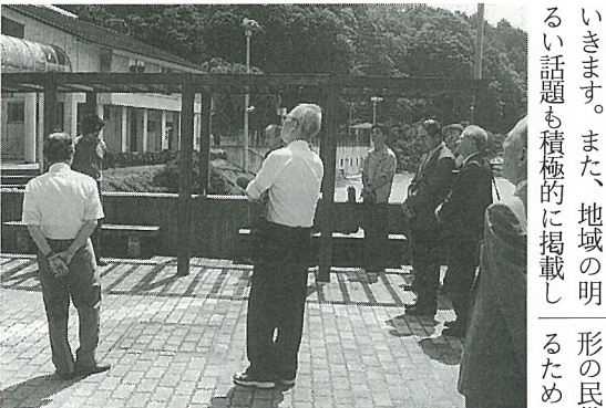
公民館建設に向けて、施設部会の視察

「手づくりの文化事業の実践を通じ、地域住民の交流と学習の場を幅広く提供していく」との活動方針を定めました。事業としては、分館を中心とした特色ある人形劇、文化活動の高揚と親睦を図る地区文化祭、ニューイヤークンサートをベースに芸能発表を取り入れた新年会、気持ち良く暮らしていくための市民大学講座と、数多く計画しました。