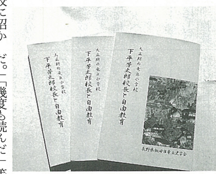
希望が多く、2百部増刊

「二十八メートル道路測量説明会開かれる」 去る、八月一日、桐林区民センターにおいて、県道桐林大明神原線の建設に伴う測量の説明会が開催されました。 道路の概要は、現在の県道上川路大畑線を県道桐林大明神原線に格上げをするというもので、この道路は三遠南信道天竜峡インターや治水対策事業で整備される地域へのアクセス道路として整備されるものです。 大まかなルートは、川路大明神原からJR川路駅付近を通り、現在の飯田線を通り、久米川を渡ってから安城を通り、国道一五二号沖田石材店へタッチする全長約四千二百八十メートル、幅員二十八メートルの道路です。 この道路の計画に至る経過は、五月七日の飯田市都市計画審議会、六月十七日