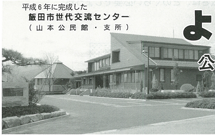
平成 6 年に完成した 飯田市世代交流センター (山本公民館・支所)