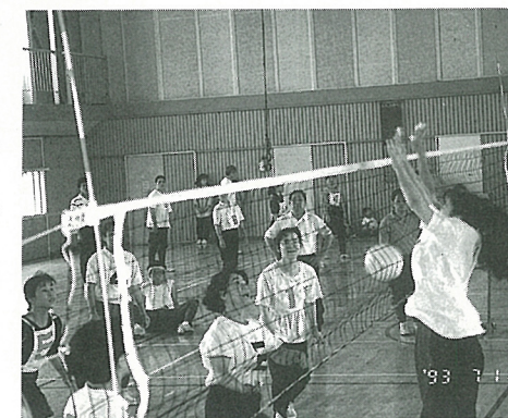
ブロックしてはみたものの…