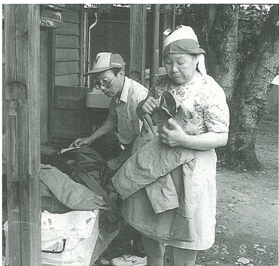
虫干しで貴重な資料 後世に…

去る、八月一日午後から民俗資料館において、その道員達の年に一度の日光浴「虫干し」が、委員の方々の手で行われた。 家の改築に伴い失われて行く古くから使われてきた道具等を何とか残そうと当時の文化部の方々がこの保存委員会を発足させた。竜