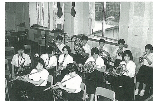
ピカピカの楽器はどんな音

緑ヶ丘中学校より、以前から要望のありました吹奏楽部の楽器を新しく購入する事が出来まし。本来なら各家庭に案内など回し、負担をお願いしたいところでしたが、今後予想される、公民館や、緑ヶ丘中学校の改築時の事を考え、今回は三地区とも自治会費より賄う事に決まり、購入されました。