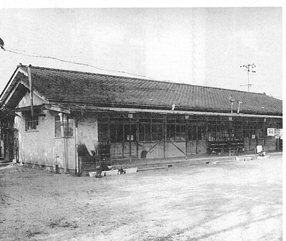
新築移転を待つ園舎

計画では、場所は現在の保育園と通学路を挟んだ反対側で用地面積は二六〇七坪で本体はモダンなものを目指し現在鋭意設計中で近々完了する予定です。