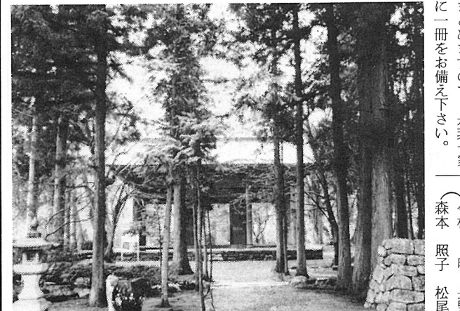
開善寺正門 - 丘の語り部たち表紙より -