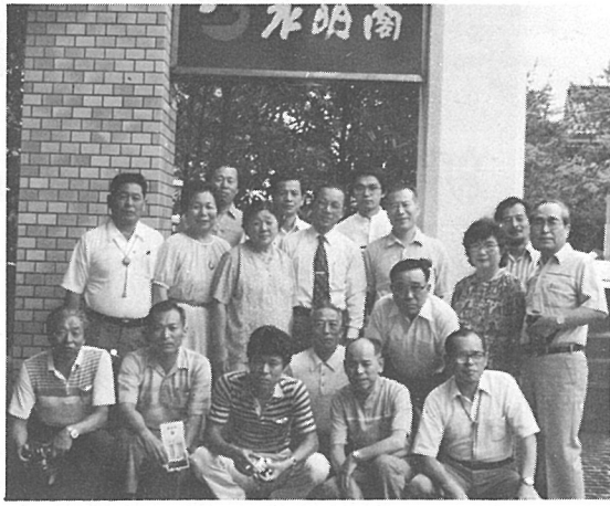
ポチポチ、アルコールが欲しいナー