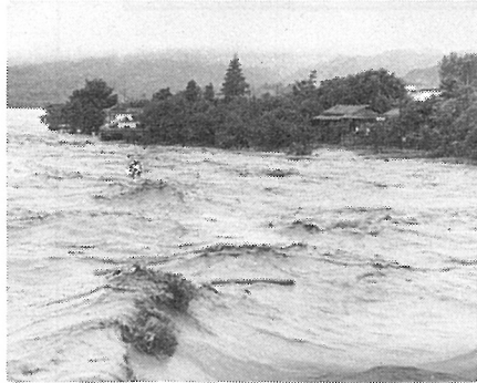
激流に吞まれる同地籍

六世帯で二八世帯、五七五人が被害を受けている。二十周年の去る六月二十七日、こうした災害、水難事故に備え、竜丘地区自主防災連絡協議会により、午後一時より、救急法の講習会が行われた。五十余名が参加し、消防署員講師の指導で、消火器の扱いや心肺蘇生法、避難方法などについて指導を受けた。地区民に「丘の語部たち」では十分とはいえない。東海地震も予想される今日、記念誌等の形でも貴重な資料を地区民に残す必要もある。 災害の二因になった中電泰早ダムによる河床上昇も現在では、ずと下がり、立派な堤防も完備されている。一方、松川ダムには予想