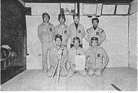
新調したオレンジ・ユニホームで決める

「弘法様」を詳しく紹介します。このチームは上川路に住む十五名のスポーツ愛好者の集まりで、チーム名「弘法様」は上川路の奥の山の頂にある弘法大師の御名にちなんで弘法大師の御「下は十八才から上は四十八才迄利益を期待して付けた三十才も違う人達が集まっている