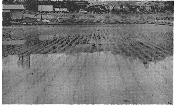
すでに田植が始まった 小池地区