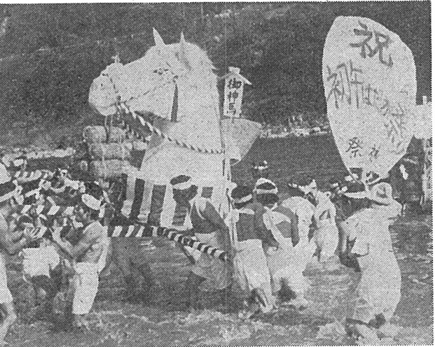
時又初午はだか祭り... ミソギの「コマ」...

葬祭の現状と問題点をテーマにしたグループ発表の様子。参加者たちは真剣な表情で発表を聴き、時には拍手を送っていた。