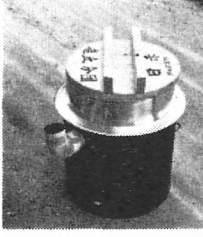
火災、水害、病氣、さらにはあちこちで起る交通事故等、ケケンが迫っています

私達のまわりには、火災、水害、病氣、さらにはあちこちで起る交通事故等、ケケンが迫っています