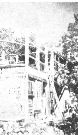
【写真は上川路地籍で】