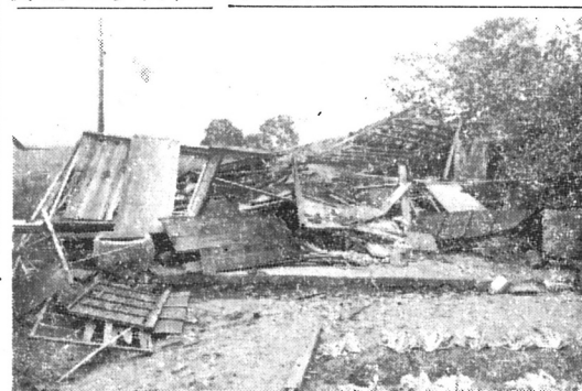
【写真は強風で全壊した家屋】