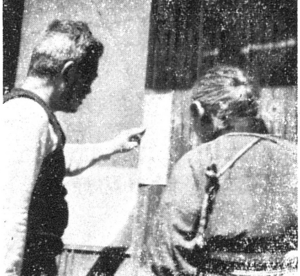
【写真説明】「選挙の魔の手」を防ぐための「防戸」の設置。投票の公正を確保するための措置。

注目される社教法の改正 この法の改正は、国民の権利を保障し、選挙の公正を確保することを目的として行なわれる。改正された法律は、選挙の公正を確保し、国民の権利を保障することを目的として行なわれる。