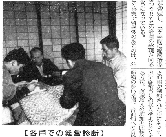
【各戸での経営診断】

この事業で特異性のあるのは、各戸での経営診断。この事業は、農協が中心となり、農家の協力を得て進められている。この地区の農道建設は、農協が中心となり、農家の協力を得て進められている。