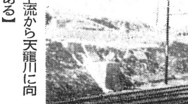
新川の護岸工事現場... 新川の護岸工事現場...