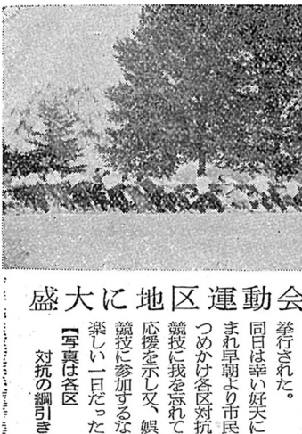
盛んに地区運動会終る

この会の趣意は、われ等村民が 挙げて一堂に会し、過去の龍丘村 を語り合ひ、祝賀し合ひ、こま ま龍丘村を建設して来た故人を このひ、故人に感謝の意を表するこ として、この自覚を高めようではない か。 (木下)