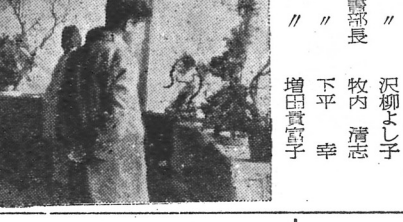
写真説明 上は 全村慰安の夕べ 下は 生花展示会