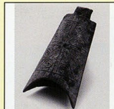
鎧塚古墳出土馬鐸