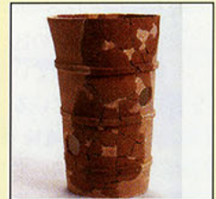
二子塚古墳出土埴輪