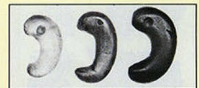
鎧塚古墳出土勾玉