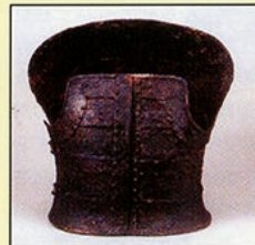
鎧塚古墳出土短甲